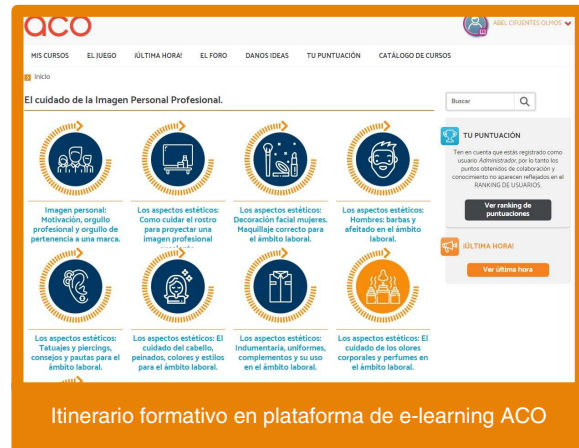
Itinerario formativo en plataforma de e-learning ACO